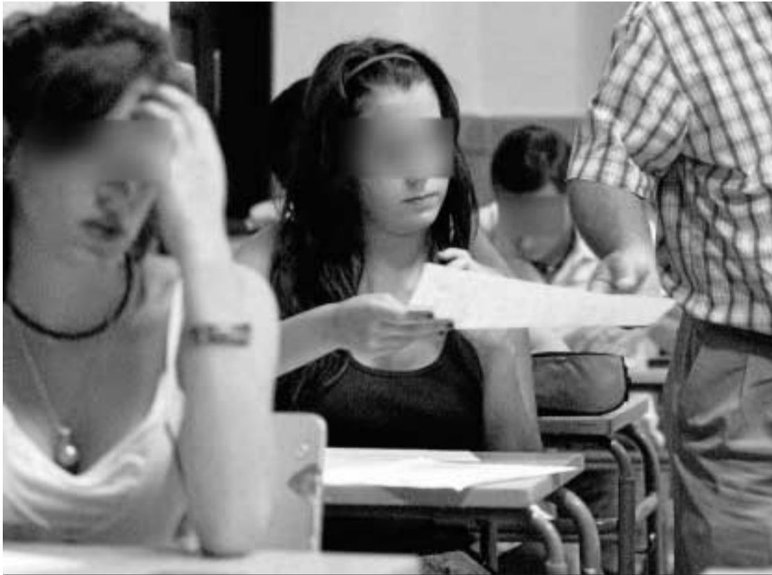
Un profesor entrega un examen a una alumna.

Las familias aseguran que el derecho a la huelga "impide" el derecho a la educación • Los profesores exigen ampliar al personal para garantizar la seguridad