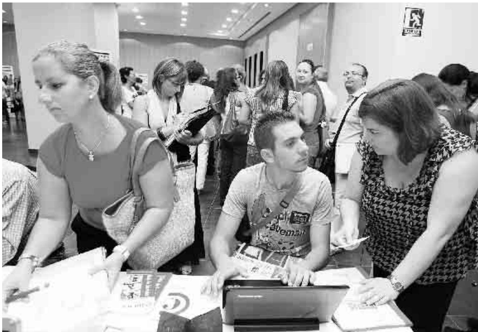
Varios asistentes en uno de los expositores de información, ayer, en la I Feria de Empleo y Formación.