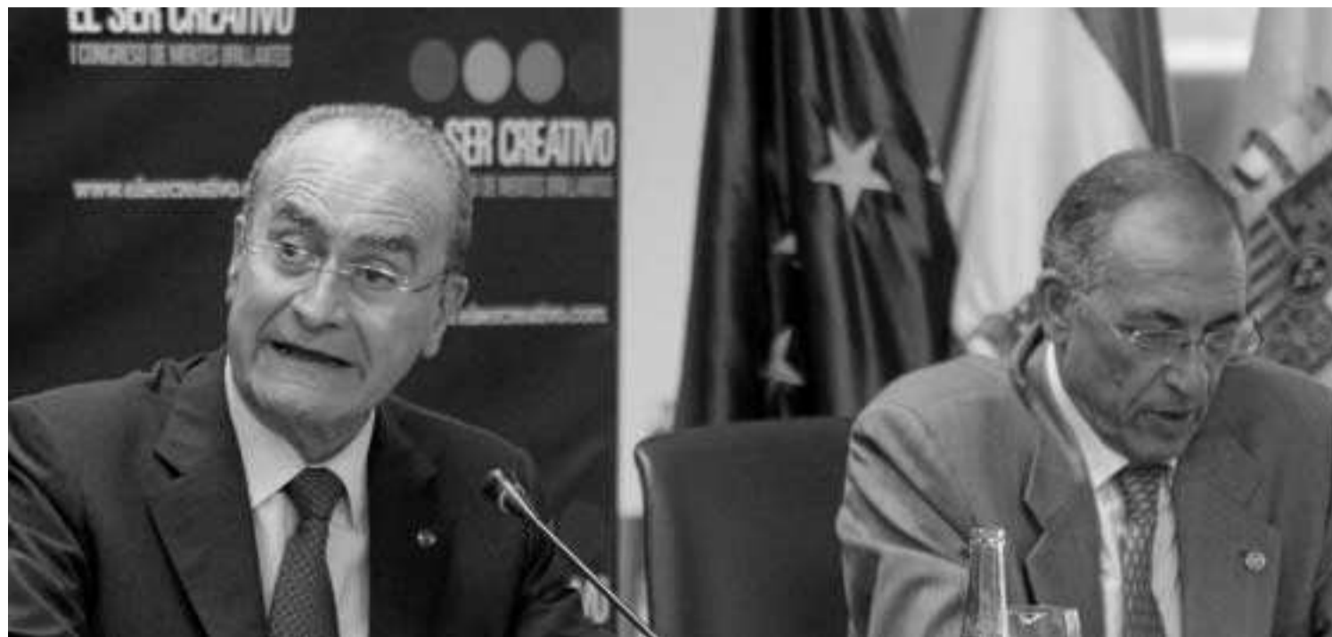
El alcalde de Málaga (izda.) y el presidente de la Fundación Málaga Ciudad Cultural, ayer durante la presentación del congreso 'Mentes brillantes'.

ARTE Vea en la web las imágenes del especial sobre Dalí, García Lorca y la Residencia de Estudiantes